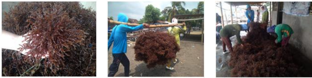
Gambar 3. Pemanenan rumput laut dengan mengangkat seluruh tanaman

keruh, mampu tetap hidup pada salinitas rendah, dan tahan terhadap curah hujan tinggi.