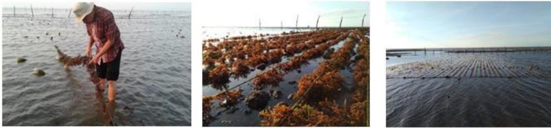
Gambar 2. Budidaya rumput laut K. Alvarezii di pesisir Desa Agel, -Situbondo

penurunan kualitas budidaya yang ditandai dengan jumlah bobot mutlak yang tidak mengalami peningkatan bahkan hasil panen yang berkurang. Hal ini disebabkan oleh penurunan kualitas air serta adanya organisme pengganggu yang menempel pada rumput laut. Hama rumput laut antara lain larva bulu babi ( Tripneustes sp ) yang bersifat planktonik dan menempel pada thallus , larva kekerangan ( Trochophore ) yang awalnya menempel dan setelah dewasa memakan rumput laut dan ikan baronang ( Siganus sp ). Menurut Parenrengi, Rachmansyah, dan Suryati (2010) solusi untuk menghindari ancaman organisme pengganggu seperti ikan baronang adalah melalui pola penanaman serentak. Metode budidaya rumput laut di Pesisir Agel ditunjukkan pada Gambar 2.