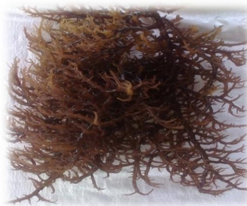
Gambar 5. Tampilan morfologi rumput laut hasil uji kedalaman 10 cm

Selama kegiatan dilakukan pengambilan sampel setiap minggu. Pengambilan sampel air dan pengukurannya dilakukan oleh Tim Kesehatan Lingkungan BBPBL Lampung. Data hasil pengamatan kualitas air se-lama masa uji coba ditampilkan pada Tabel 1.