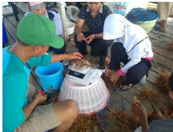
Gambar 1. Seleksi dan penimbangan bibit pada awal kegiatan penelitian

kedalaman 10, 30 dan 50 cm. Agar posisi tali jalur berdiri tegap maka pa-da bagian bawah setiap tali diberi pemberat. Menurut Direktorat Jenderal Perikanan Budidaya (2008), jika rum-put laut digunakan untuk bibit, maka rumput laut digunakan untuk bibit, maka rumput laut dipanen setelah berumur 25-35 hari. Sedangkan supaya kan-dungan karaginan tersedia lebih banyak, maka panen sebaiknya ber-umur enam minggu atau 45 hari. Bibit yang digunakan adalah bibit rumput laut kotoni hasil kultur jaringan de-ngan kriteria: (a) umur panen 25 hari; (b) bercabang banyak dan rimbun; (c) thalus mulus (tidak