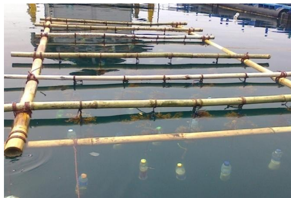
Gambar 2. Konstruksi rakit bambu apung yang telah ditanam tanaman uji