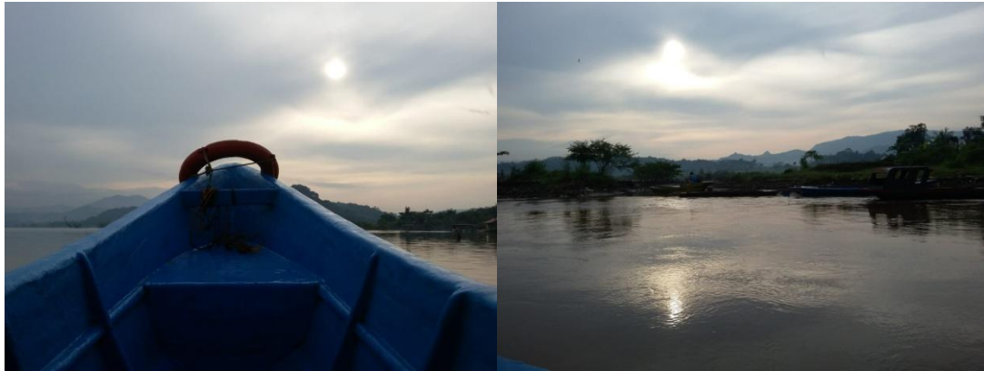
Gambar 2. Tampilan keindahan alam Waduk Jatigede, saat matahari terbit